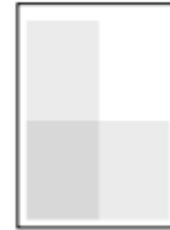
Halvsida 200 x 142 mm 99 x 287 mm