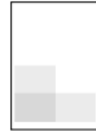
Kvartsida 99 x 142 mm 200 x 70 mm