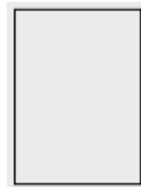
Helsida 210 x 297 mm + Utfall 3 mm

* Vi bjuder på en annonsmodul i våra kartor vid köp av en helsideannons (värde 2 300 kr).