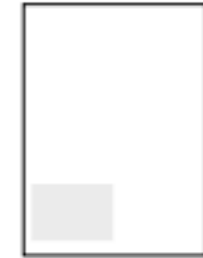
Åttondel 99 x 70 mm